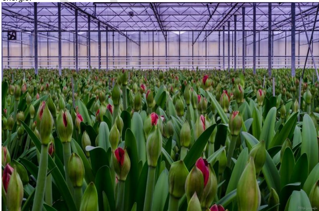
Tulpenkas (Gemeente Lingewaard, 2019).

NEXTgarden is het ontwikkelgebied voor de tuinbouw. Vanuit hier is de aansluiting te maken met de stadsregio Arnhem-Nijmegen en Wageningen, waar op het verbouwen van gezonde voeding wordt ingezet. Lingewaard draagt bij aan de productie van (gezonde) voeding vanuit de glas- en tuinbouwsector. Vanuit de glastuinbouw bestaan kansen voor duurzame gebiedsontwikkeling en energietransitie maatregelen. Deels worden deze nu ook al benut, met als belangrijkste voorbeeld het drijvend zonnepark ten westen van Huissen. De gemeente Lingewaard heeft de ambitie energieneutraal te zijn in 2050. Waar mogelijk wordt gestreefd naar dubbel ruimtegebruik in de gemeente, waarbij verschillende ruimteclaims worden afgestemd. In Lingewaard is NEXTgarden de plek waar actief ingezet wordt op het realiseren van diverse vormen van duurzame energie.