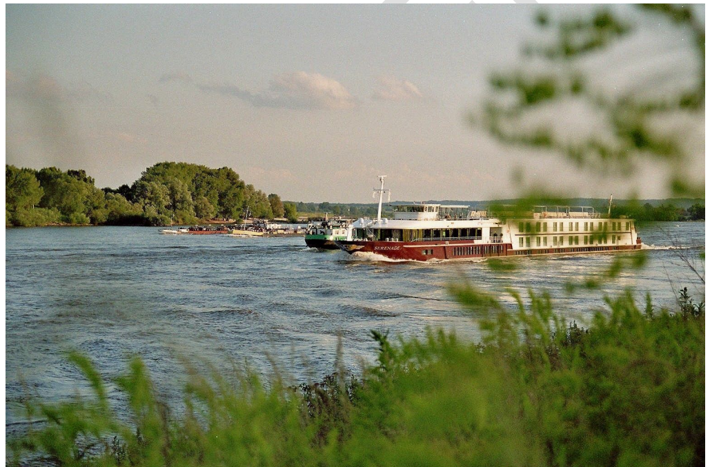
Looveer (Gemeente Lingewaard, 2019).

Het ontwikkelen van waterbergingsfaciliteiten is een belangrijke opgave in de gemeente. Het rivierenlandschap in de gemeente Lingewaard zorgt ervoor dat waterberging altijd al een belangrijk onderwerp is geweest. Met de komst van klimaatverandering, blijft dit ook richting de toekomst een belangrijk thema. Het deltaplan is van belang om de kernen droog te houden met klimaatverandering. Kansen zijn er voor het ontwikkelen van groene, waterrijke gebieden en het verbeteren van de toegang tot de rivieren, waardoor de leefbaarheid toeneemt. De transitie naar duurzame energie kan in een rivierenlandschap ruimte krijgen door de ontwikkeling van aquathermie (warmtewinning uit oppervlaktewater). Naast een rivierenlandschap, is sprake van een cultuurlandschap door de aanwezigheid van steenfabrieken in dit Natura2000 gebied.