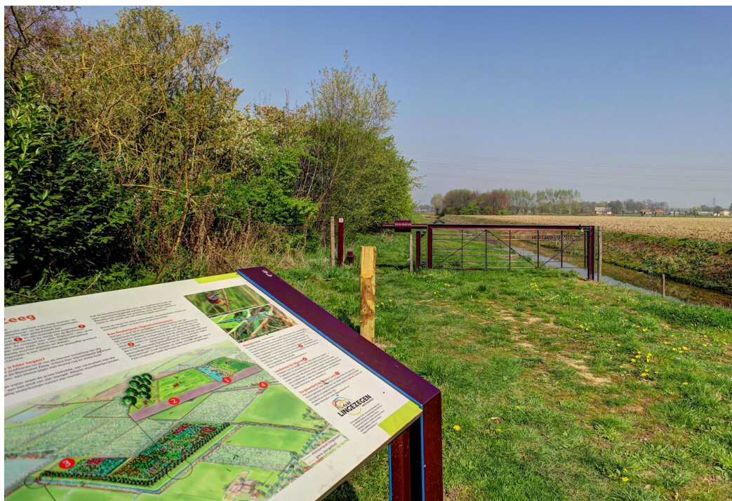
Park Lingezegen (Gemeente Lingewaard, 2019).