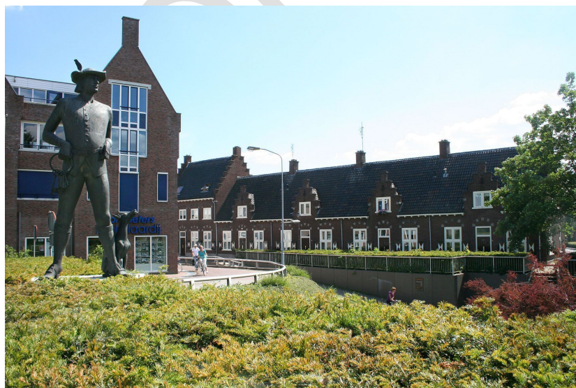
Arnhemsepoort (Gemeente Lingewaard, 2019).

De voorzieningen (zowel maatschappelijke voorzieningen als zorg voorzieningen en) worden geconcentreerd in de grootste kern; Huissen, Bemmelen en Gendt. Hiermee komt de gemeente Lingewaard tot steeds compactere gebieden. De gemeente organiseert de toegang tot basisvoorzieningen, ondersteuning en hulp in de leefomgeving van inwoners en maakt daarbij gebruik van de lokale kracht en initiatieven. Centrumontwikkeling is nodig in Huissen en Bemmelen om de koopkracht te vergroten en daarmee de aantrekkelijkheid van deze kernen als winkelcentrum. Doornenburg heeft twee toeristische trekpleisters (kasteel Doornenburg en Fort Pannerden). Een kans bestaat om de mensen die buiten de kern verblijven, te verleiden om ook het centrum van andere kernen te bezoeken.