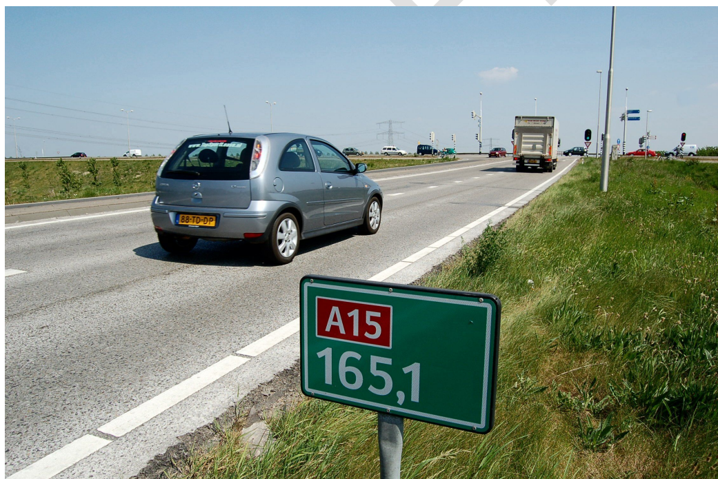
A15 bij Bemmel (Gemeente Lingewaard, 2019).

draagt bij aan de gezondheid van inwoners van de gemeente.